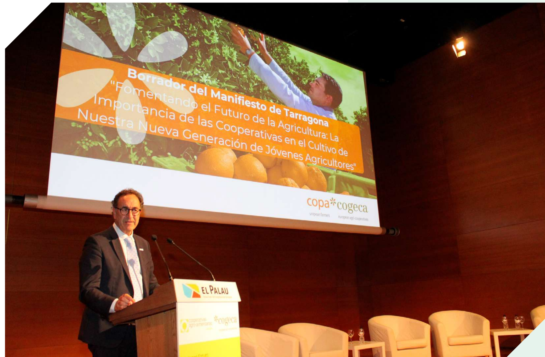
Ramón Armengol presidente de la COGECA.

En la clausura, el entonces presidente de la COGECA, Ramón Armengol, anunció la publicación del Manifiesto de Tarragona, un conjunto de objetivos colectivos aspiracionales centrados en cómo las cooperativas pueden apoyar a los nuevos agricultores. El manifiesto de Tarragona esboza los objetivos clave para apoyar el desarrollo profesional de los jóvenes agricultores y ganaderos, proporcionar apoyo financiero a sus proyectos y fomentar su participación en la gobernanza cooperativa.