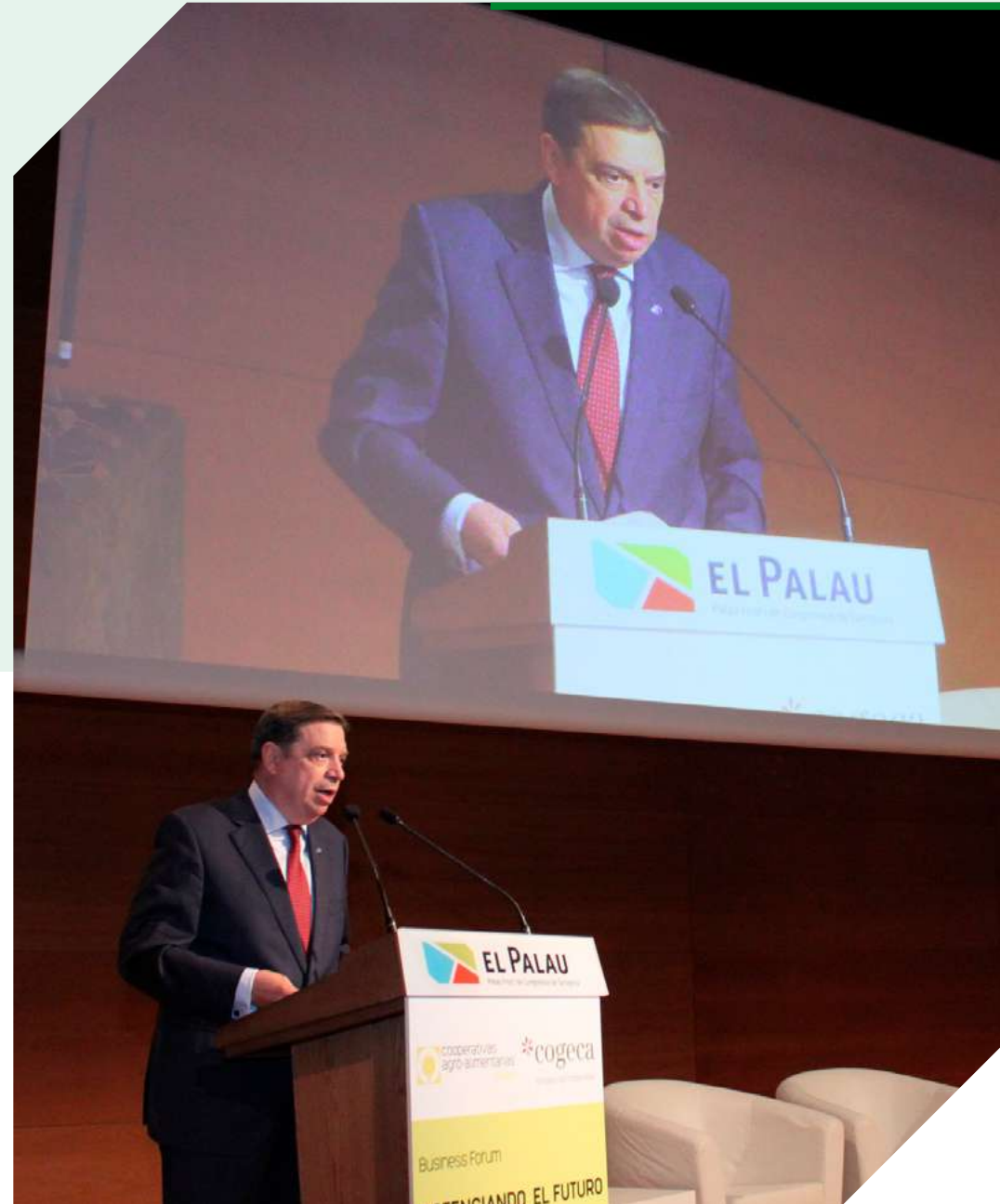
El ministro de Agricultura, Pesca y Alimentación, Luis Planas durante la inauguración del Foro celebrado en Tarragona.