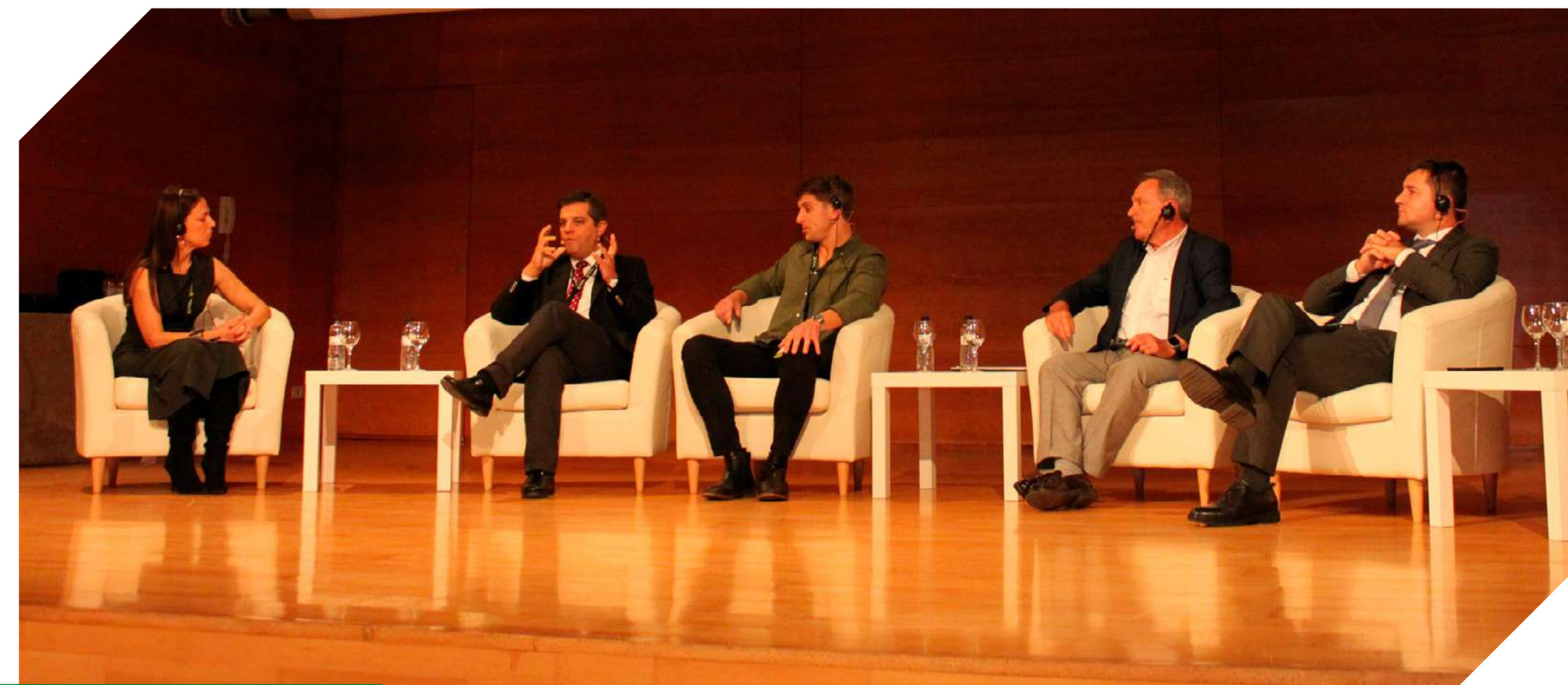
Segunda mesa redonda centrada en el papel de las cooperativas.