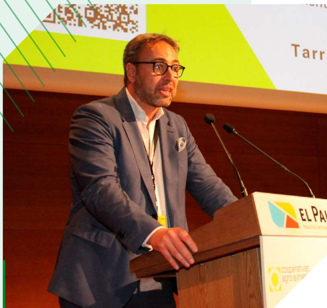
Gabriel Trenzado, director general de Cooperativas Agro-alimentarias de España.