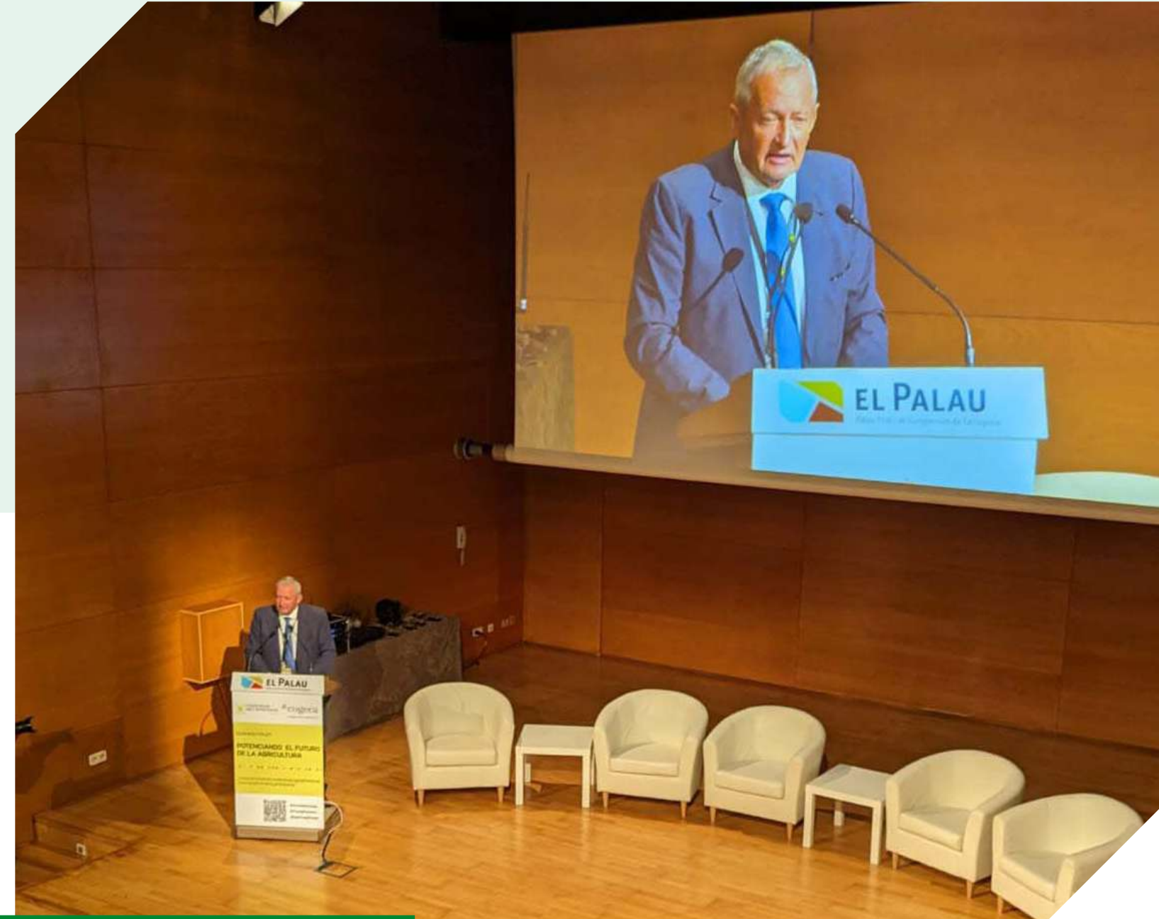
Ángel Villafranca, presidente de Cooperativas Agro-alimentarias de España.