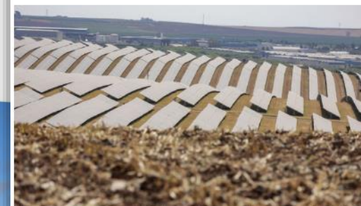
El parque fotovoltaico más amplio grande de Guillena visto desde un campo de maíz recién cosechado

Fondos de inversión extranjeros están pagando rentas en la actualidad de hasta 1.900 euros por hectárea y año a los dueños de estos suelos por alquileres de 25, 50 y hasta 75 años, frente a los 1.000 euros que se pagaban en los inicios