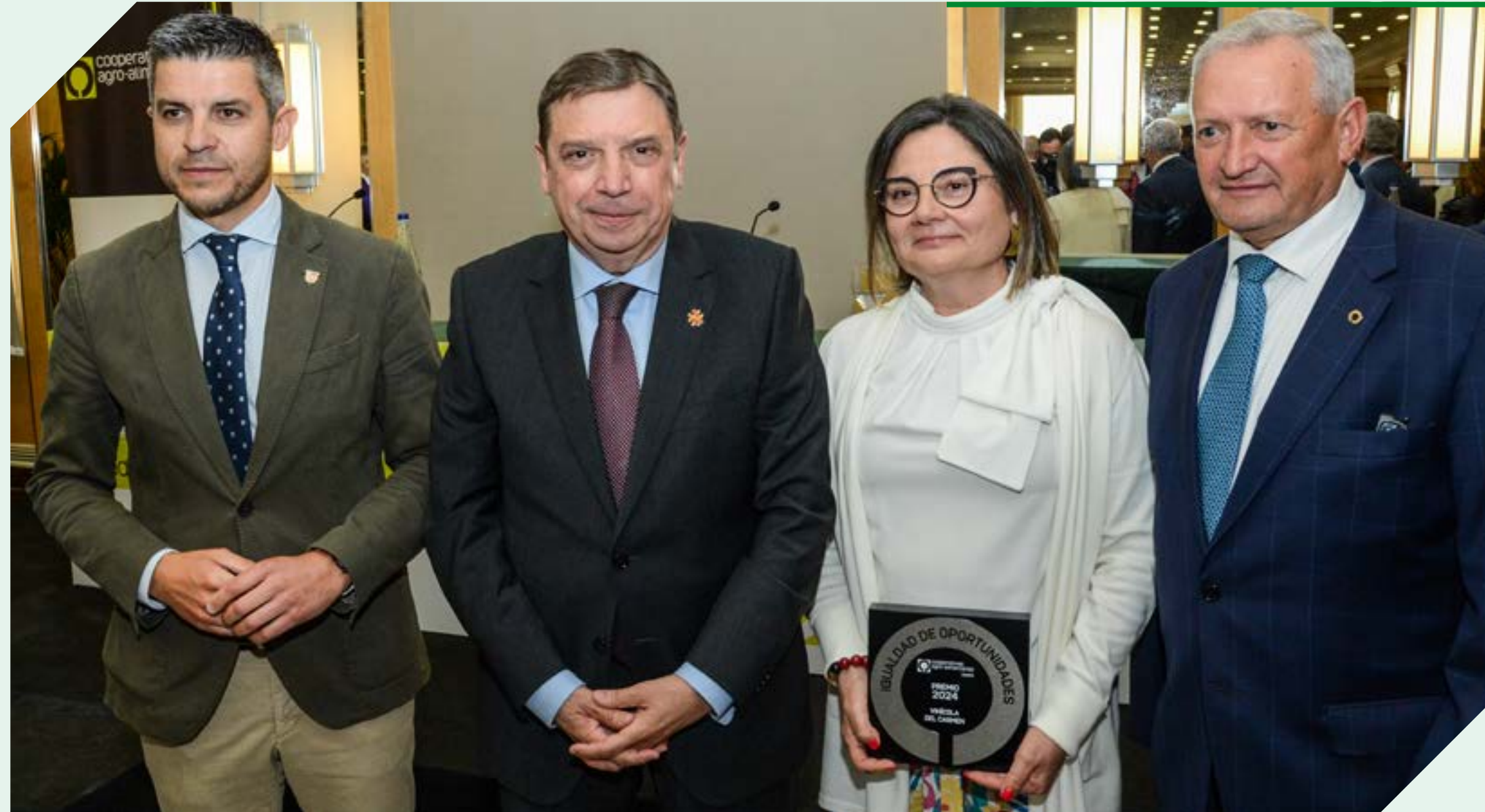
De izquierda a derecha: Santiago Lázaro, alcalde de Campo de Criptana, Luis Planas, ministro de Agricultura, Julia Mercedes Leal, presidenta de Vinícola del Carmen y Ángel Villafranca, presidente de Cooperativas Agro-alimentarias de España.

Por último, aprovechó para pedir al ministro Luis Planas que “cuenta con los agricultores, con la gente de a pie, con la que pisa el terrón; porque somos la garantía de futuro de la mayor parte del territorio español”.